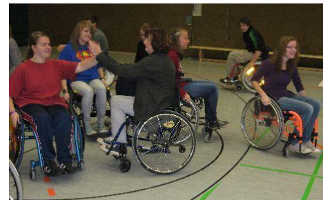
Mobil trotz Rolli—SuS im Projektversuch

Die Klassen 9e und 10e haben an einen Projekttag zum Thema „Inklusion und Mobilität - Rollstuhlsport macht Schule“