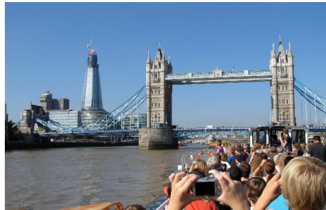
SuS vor der Towerbridge in London

Zu Beginn eines jeden Schuljahres finden die Klassenfahrten des 6er und 10er-Jahrganges statt. Auf Wunsch der Schulkonferenz gibt es ein kurzes Zeitfenster von etwa zwei Wochen, in denen die Fahrten durchgeführt werden. Stellvertretend für alle Touren hier ein kurzer Bericht über die Fahrt der 10d nach England: