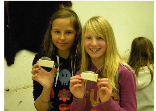
Mädchen in der Steinzeitwerkstatt

In der Steinzeitwerkstatt fertigte jede Schülerin und jeder Schüler ihr bzw. sein eigenes Steinzeitmesser aus einem Holzblock, einer Feuersteinklinge und Steinzeitkleber an. Einige verzierten ihr Messer mit Schriftzügen und gestalteten es so zu einem individuellen Andenken an diesen spannenden Tag im Neanderthal.