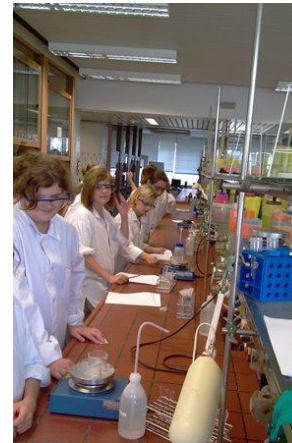
SuS in der Forschung