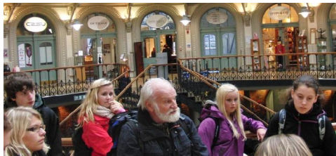
Interessierte SuS beim Englandaustausch